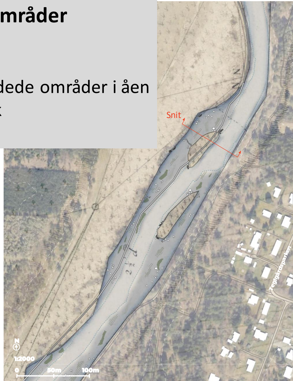
EKSEMPEL PÅ FREMTIDIGE FORHOLD